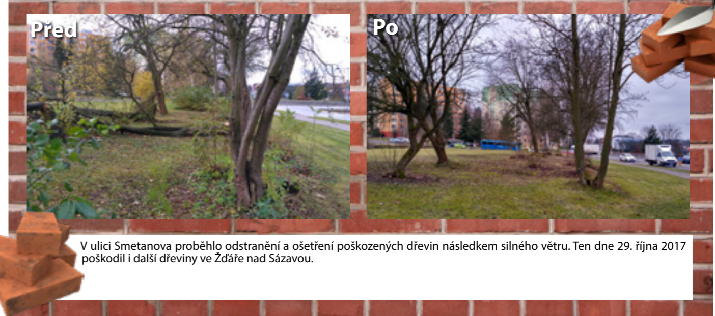
V ulici Smetanova proběhlo odstranění a ošetření poškozených dřevin následkem silného větru. Ten dne 29. října 2017 poškodil i další dřeviny ve Žďáře nad Sázavou.