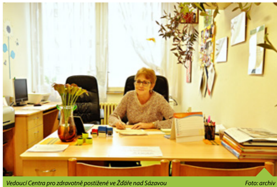
Vedoucí Centra pro zdravotně postižené ve Žďáře nad Sázavou