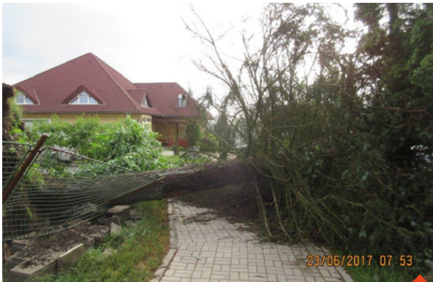
Pád stromu po vichřici na mateřskou školu