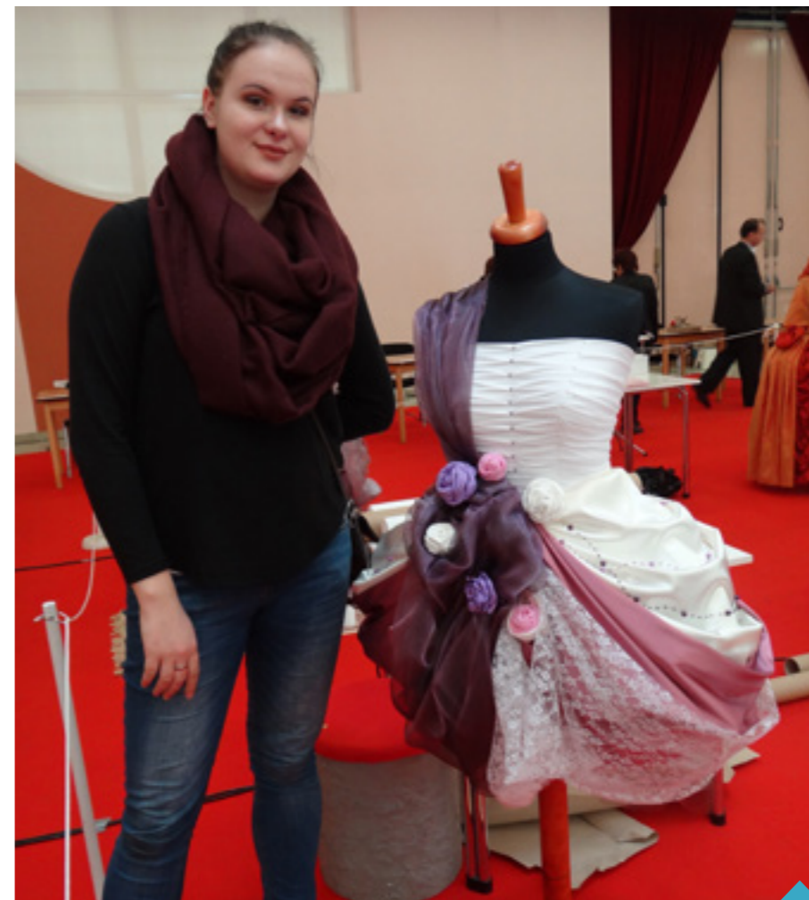
Žďárské studentky se v republikové konkurenci neztratily