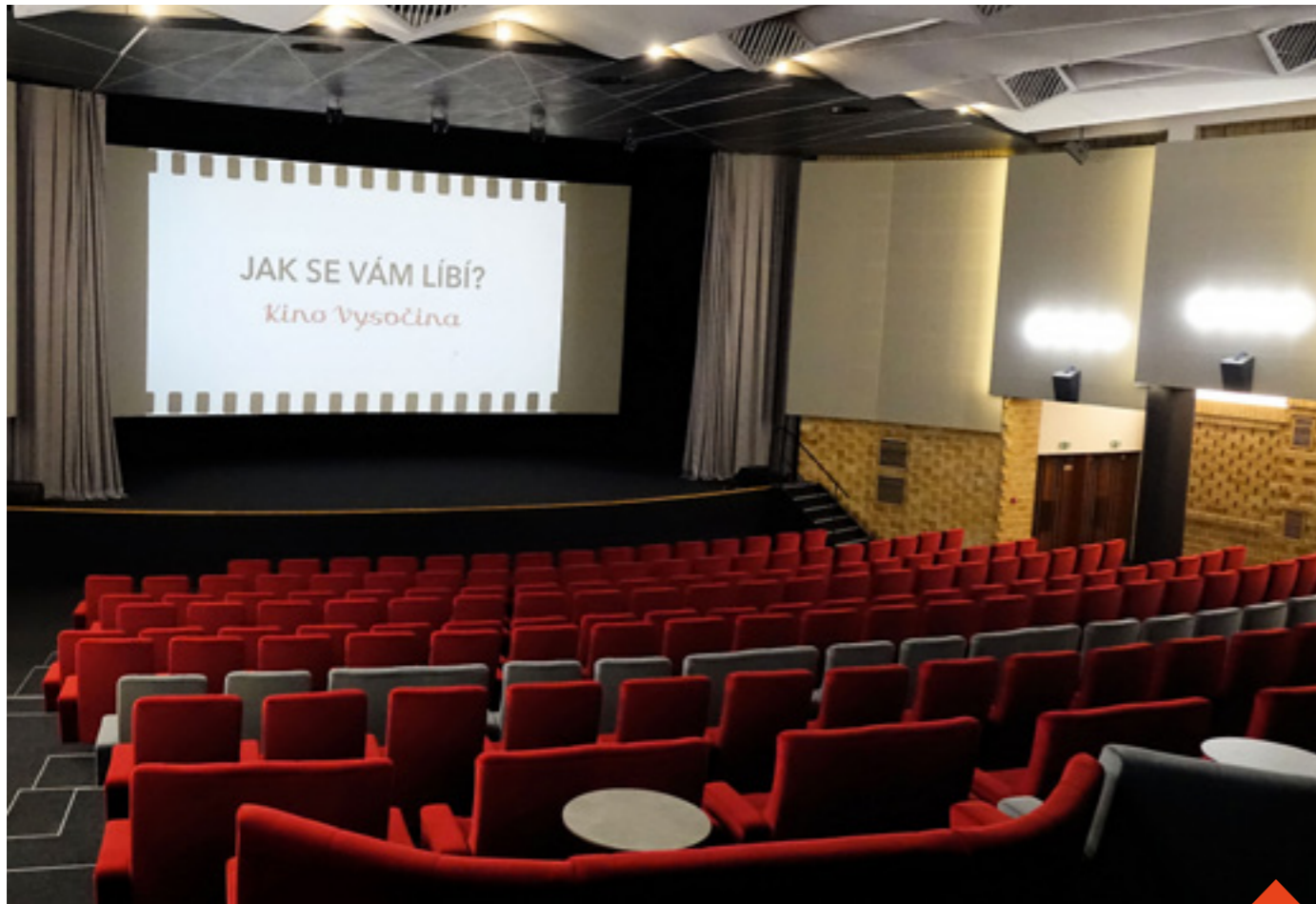
Slavnostní otevření Kina Vysočina