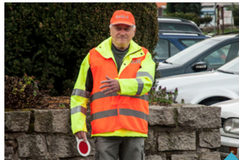
Bezpečnostní asistenti jsou u šesti frekventovaných přechodů