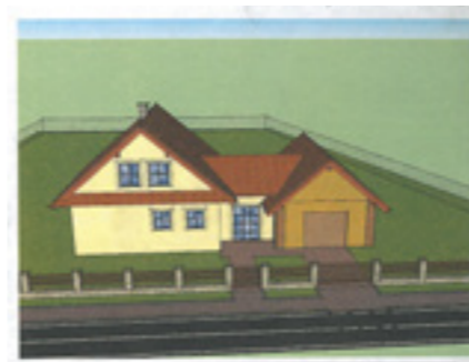
Projektová dokumentace

Dne 1. ledna 2018 vstoupila v platnost novela stavebního zákona, č. 183/2006 Sb. Zmíněnou právní úpravou došlo ke změně mimo jiné v rámci umísťování a povolování staveb. Přinášíme vám přehled některých změn a dopadů na obyvatele Žďáru nad Sázavou.