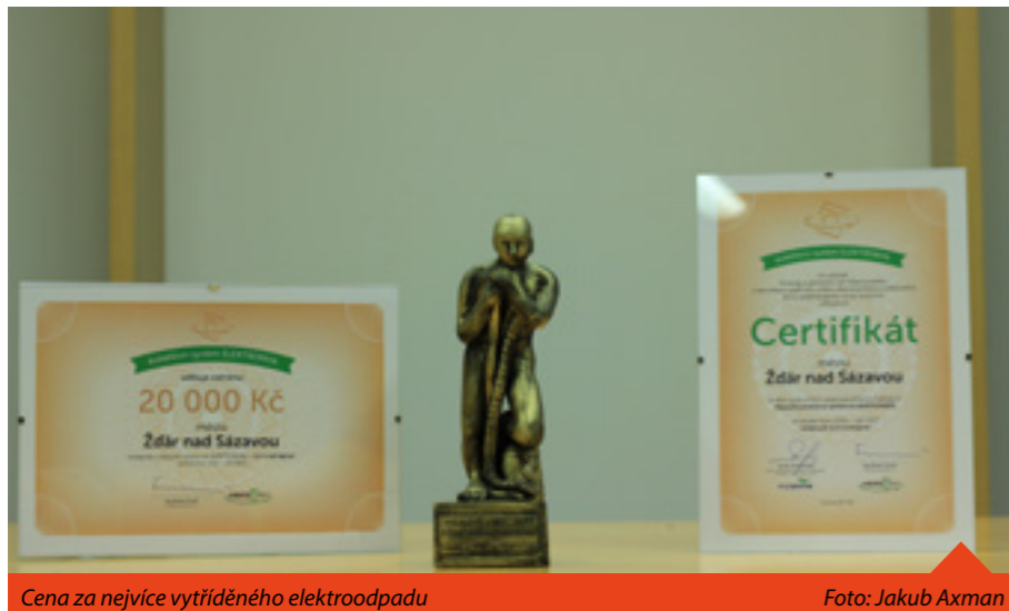
Cena za nejvíce vyříděného elektroodpadu

Věci jsou k vyzvednutí na Městském úřadě u Aleny Benešové - 566 688 146.