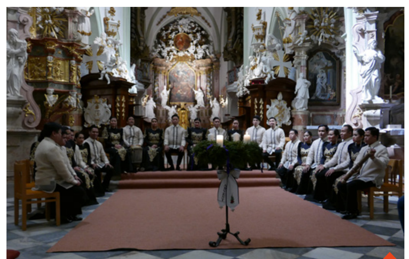
Koncert slavného filipínského sboru v bazilice