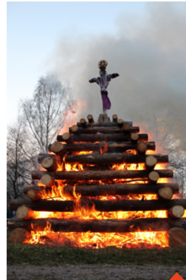
Žďárská filipjakubská noc