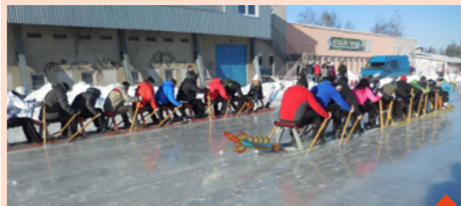
Závody dračích lodí se mohou konat i bez vody