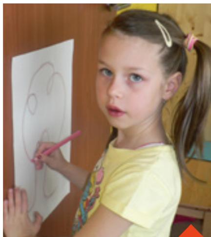
Předškoláci se připravují