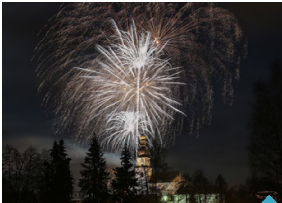
Novoroční ohňostroj ve Žďáře se letos povedl