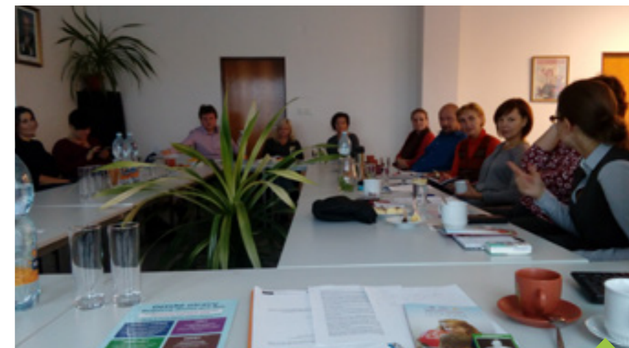
Tým pro mládež se aktivně schází

Mezi zúčastněné patří zástupci městských úřadů z celého okresu Žďár nad Sázavou (orgány sociálně-právní ochrany dětí), Policie ČR a Městské policie, Probační a mediační služby ČR, Okresního soudu, Pedagogicko – psychologické poradny, Krajského úřadu Vysočina (Odbor sociálních věcí), Manželské a rodinné poradny, Centra