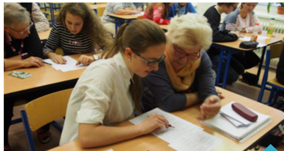
Studenti a senioři se většinou ve škole nepotkají