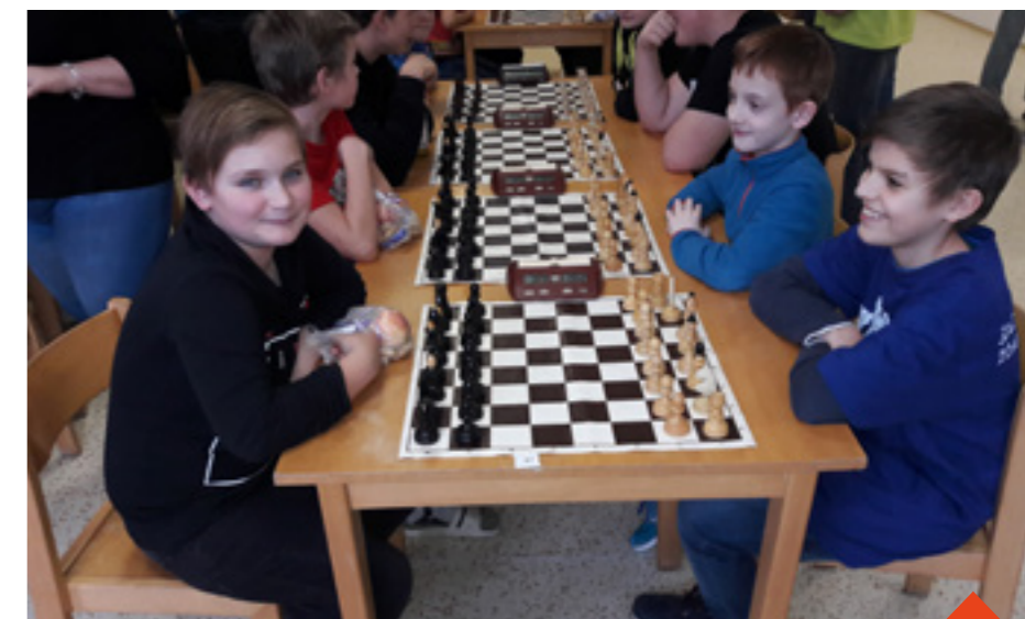
Mladí šachisté těsně před začátkem utkání