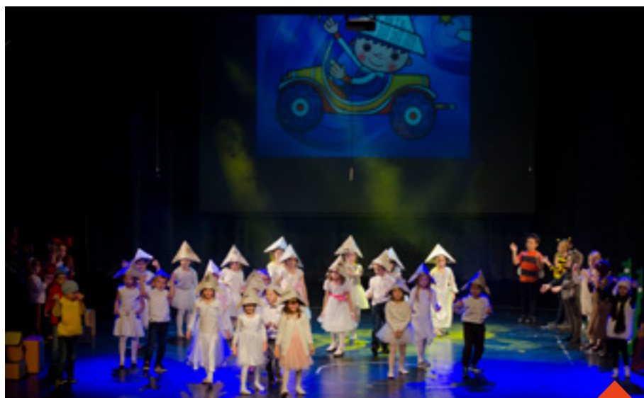
Akademie MŠ na konci roku 2017