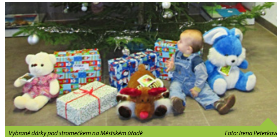
Vybrané dárky pod stromčkem na Městském úřadě

Děkujeme a přejeme všem, kteří se na projektu podíleli, radost v novém roce a doufáme, že dárky v krabicích potěšily všechny obdarované. Více o projektu na www.krabiceodbot.cz (red)